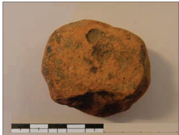
Fig. 4. Tappo ritagliato da laterizio