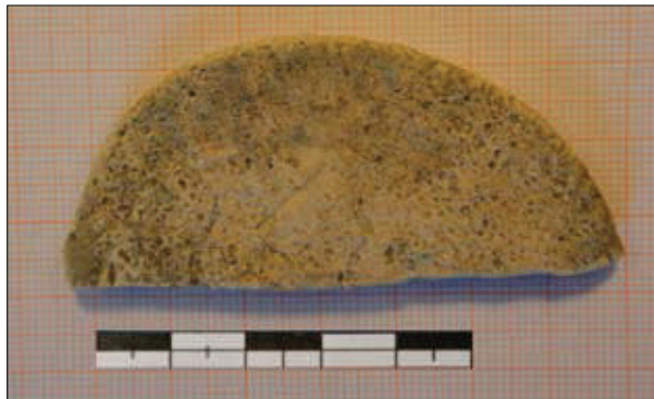
Fig. 3. Operculum a stampo frammentario.