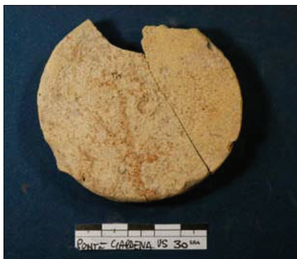
Fig. 2. Operculum a stampo frammentario.