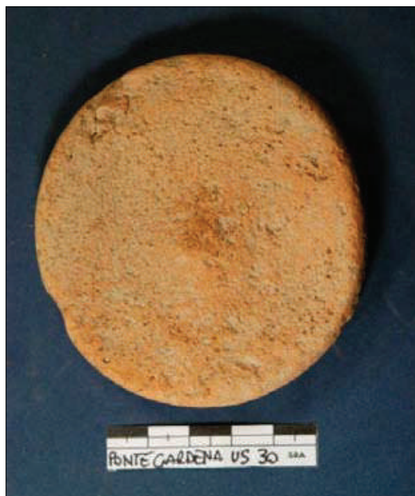
Fig. 1. Operculum a stampo integro.