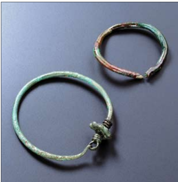
Fig. 1. Podgorica-Gruda Boljevića, dalla tomba 177.