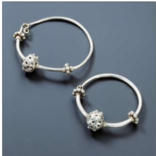
Fig. 3. Podgorica-Gruda Boljevića, dalla tomba 146.