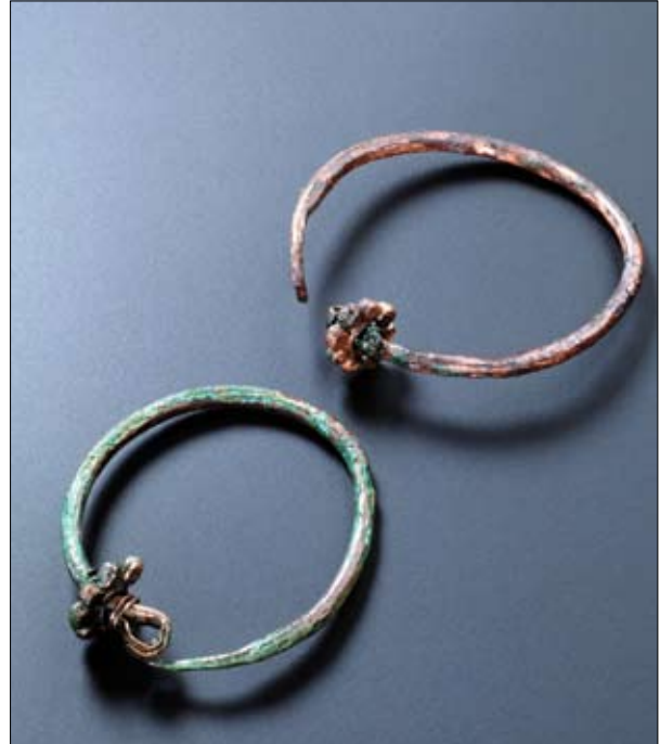
Fig. 2. Podgorica-Gruda Boljevića, dalla tomba 35.

Orecchini in bronzo o argento con una corona e una piccola perla fatta di 8 piccoli granuli sono presenti nella