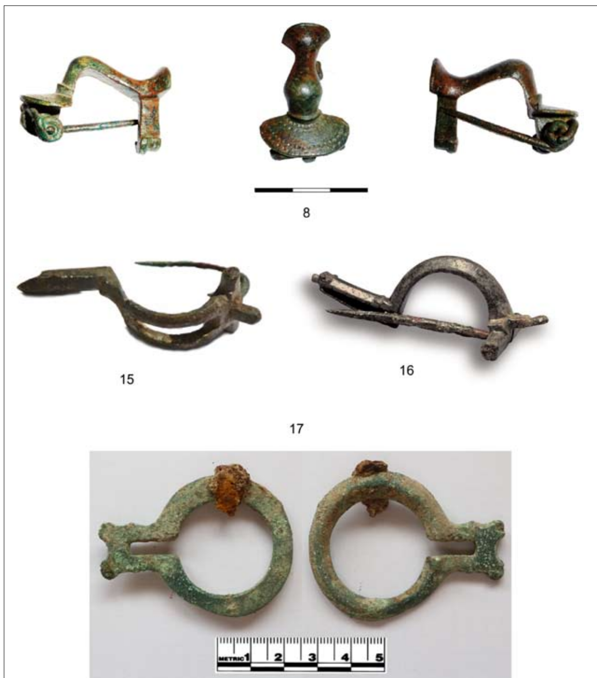
Fig 3. Nº 8 Hijes (Guadalajara), foto Cerdeño y Gamo. Nº 15 Dessobriga (Osorno, Palencia), foto Torrión (Proyecto Dessobriga ). Nº 16 La Oña (Vera de Moncayo, Zaragoza), foto García Serrano. Nº 17 cementerio meridional de Caesaraugusta (Zaragoza), foto Casabona y Aurrecochea-Fernández. Los Nº 15 y 16 sin escala.

limes danubiano, dándose la mayor concentración en Panonia, si bien también se encuentran frecuentemente en Raetia , Noricum y Mesia . En menor medida aparecen en Dacia. Más esporádicos son los hallazgos a lo largo del limes del Rin (provincias Gallia belgica y Germania inferior ), conociéndose apenas media docena de ejemplares, aun