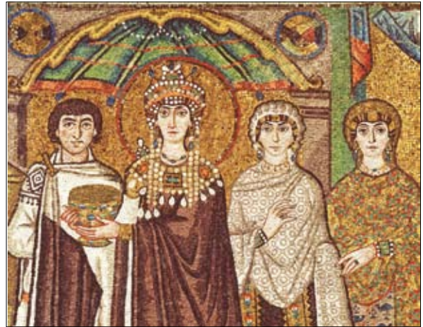
Fig. 5 A sinistra san Vitale, nel mosaico parietale della omonima chiesa ravennate.