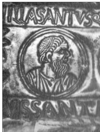
Fig. 3. Immagine di San Pietro entro un clipeo del reliquiario dei Cantiani del Duomo di Grado (da ZOVATTO 1952).

Più di settant'anni fa Paolo Lino Zovatto nel suo articolo sulla capsella dei santi Canziani rinvenuta sotto l'altare della chiesa di Sant'Eufemia a Grado osservò che il ritratto, di profilo, di san Pietro, ostenta una bella tonsura sancti Petri , costituita da una coroncina di capelli (fig. 3) sulla fronte, da un orecchio