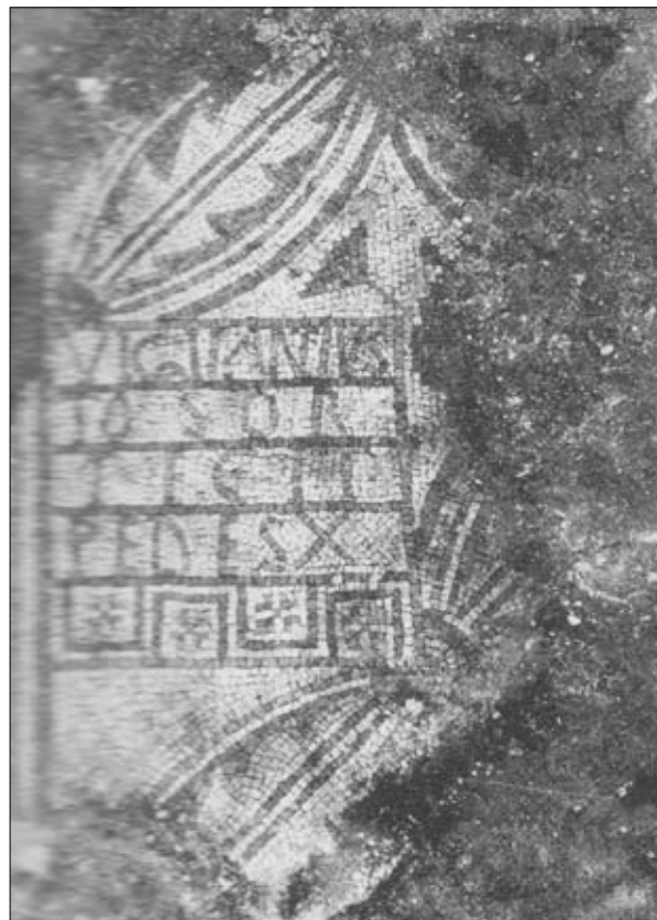
Fig. 2. Il quadrato con l'iscrizione del tonsor Vigilantius (da TAVANO 2005).

In uno dei lacerti musivi giunti fino a noi si vede il testo dell'iscrizione fatta apporre da Vigilantius il quale offrì una somma pari a 10 piedi di pavimento musivo (fig. 2). La presenza di un tonsor tra gli offerenti merita qualche considerazione.