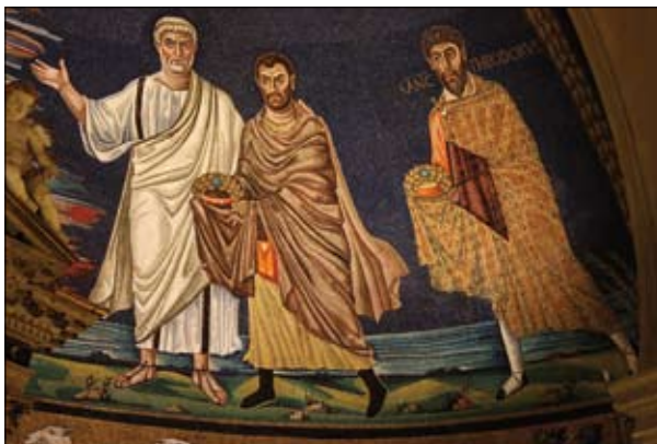
Fig. 4. A sinistra san Pietro nel catino della chiesa dei santi Cosma e Damiano.

La medesima tonsura figura anche nell'immagine di San Pietro del mosaico del catino absidale della chiesa romana dei santi Cosma e Damiano, commissionato da papa Felice IV (526-530) (fig. 4) 16 . In quel mosaico compare anche la figura di san Teodoro il cui abito è fissato con una "Zwiebelknopffibel" tipica dei decenni centrali del VI secolo, fibula che può essere utilmente avvicinata a quella presente nella rappresentazione di san Vitale nella omonima chiesa ravennate (fig. 5).