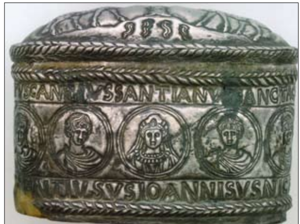
Fig. 6. Parte anteriore della capsella dei santi Canziani di Grado (da Cromazio di Aquileia 2008, p. 368).