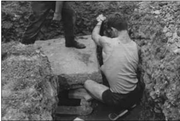
Fig. 14. La tomba all'interno del pavimento.

strettamente collegata a una possibile comunità monastica, verosimilmente di tonsurati . Almeno per questo, dunque, la presenza di un barbiere sarebbe potuta apparire necessaria in una (piccola?) comunità di monaci.