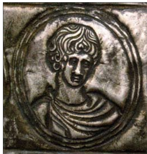
Fig. 7. Uno dei santi Canziani nella capsella di Grado.