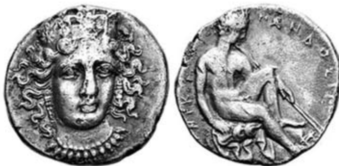
Fig. 6. Pandosia, triobolo AG. Testa di Hera Lacinia/Pan (foto: Gorny & Mosch, Auc. 289, 2022, lot 55).

Nel volume Sicilia et Magna Graecia , edito nel 1576, Hubertus Goltzius 22 illustra con disegno a stampa (tab. XXIII, IX: fig. 3) un “esemplare” di Pandosia (D/ tripode, R/ testa di Hera Lacinia) il cui diritto per elementi iconografico-stilistici ed epigrafici presenta marcate affinità con il disco de Brandis (fig. 4).