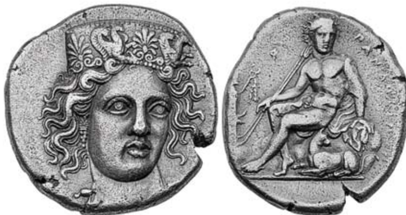
Fig. 5. Pandosia, stateri AG. Testa di Hera Lacinia/Pan (Boston, MFA, BALDWIN, BRETT 1955, n. 0196. Foto: © Museum of Fine Arts, Boston: https://collections.mfa.org/objects/4275 ).