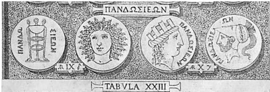
Fig. 3. Esemplici di Pandosia illustrati da Goltzius (foto: da GOLTZIUS 1576, tab. XXIII, IX-X).