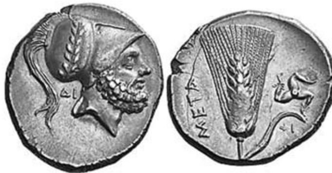
Fig. 8. Metaponto, statere AG. Testa di Leucippo/spiga e triskeles.

Si può pertanto concludere che dall'analisi compiuta, pur nei limiti evidenziati, sono emersi alcuni indizi che sembrerebbero conferire al peculiare reperto in piombo un carattere meno "isolato" di quello rilevato da Bicknell, pur nella concorde impossibilità di definirne un idoneo inquadramento giuridico. In particolare le ipotizzate analogie con le illustrazioni di Goltzius, se colgono nel segno, non escludono la cauta ipotesi di una presa visione del disco da parte dell'autore fiammingo. Il carattere di