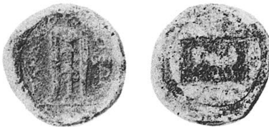
Fig. 1. Disco in Pb della coll. de Brandis (Foto: da BICKNELL 1988, fig. 5).

Vanno tuttavia evidenziati alcuni elementi di differenziazione tra le due evidenze documentali. A livello epigrafico il disco in piombo presenta l'iscrizione solo al diritto nella forma estesa ΠΑΝΔΟΣΙΕΩΝ 15 ; sulle monete a legenda \Phi ro/Pando l'etnico di Pandosia è abbreviato (ΠΑΝΔΟ) e posto sempre al rovescio,