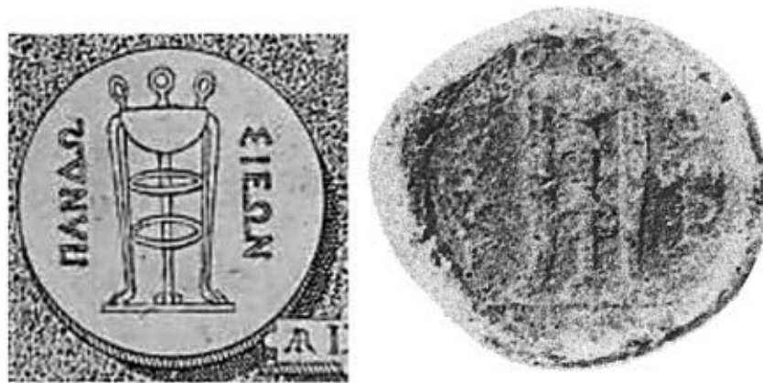
Fig. 4. Confronti: disegno di Goltzius (D/) e disco in piombo della coll. de Brandis (D/).