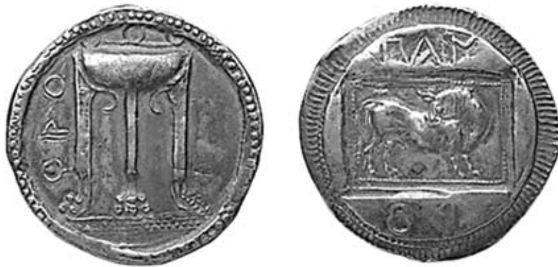
Fig. 2. Crotona-Pandosia, stateri AG. Tripode/toro retrospiciente entro rettangolo incuso (Paris, BnF, FG 1942. Foto: https://gallica.bnf.fr/ark:/12148/btv1b8599190b.r=pandosia?rk=150215;2 ).

bipartito tra il campo in alto (ΠΑΝ) e l'esergo (ΔΟ).